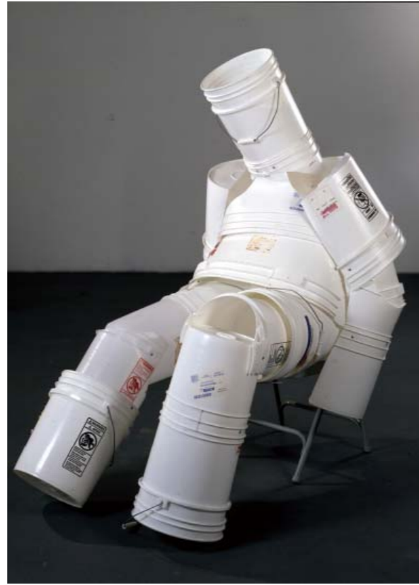
左頁：利用堆疊、組合等方式，以零散的素材構成，實現有趣的雕塑裝置 右頁：回收磚塊漆上仿如鴿子的圖案與色彩，來描寫常見的聚集景象